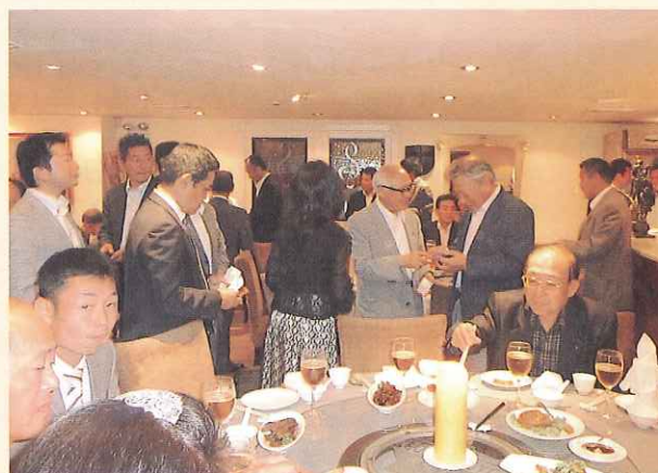
名刺交換・談笑する団員と上海企業