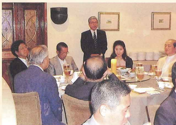
6月3日夜日系企業との交流会、JADEガーデン