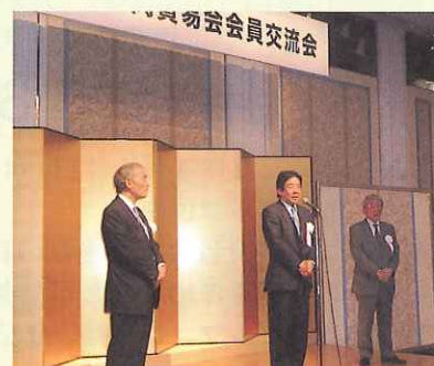
安倍新副会長の中締め挨拶