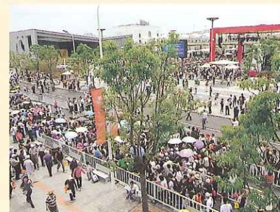
幾重にも並んだ入場者