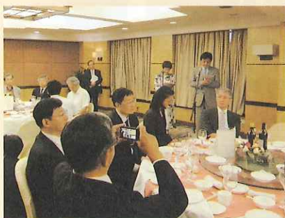
6月2日 日中港湾レセプションでの市長挨拶