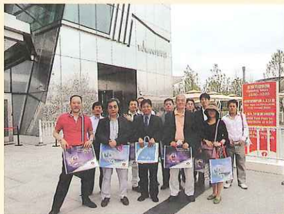
台湾館館長と一緒に