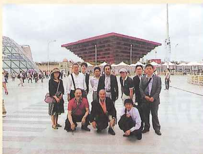
4号入場門から中国館をバックに