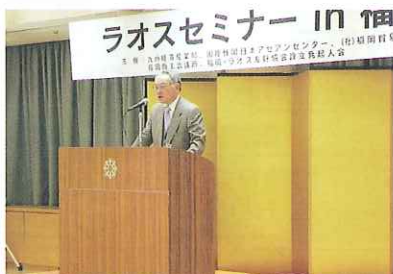
日本アセアンセンター大西事務総長の講演