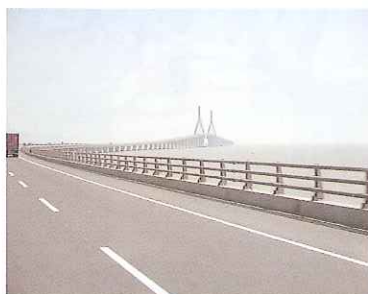
延々と続く東海大橋