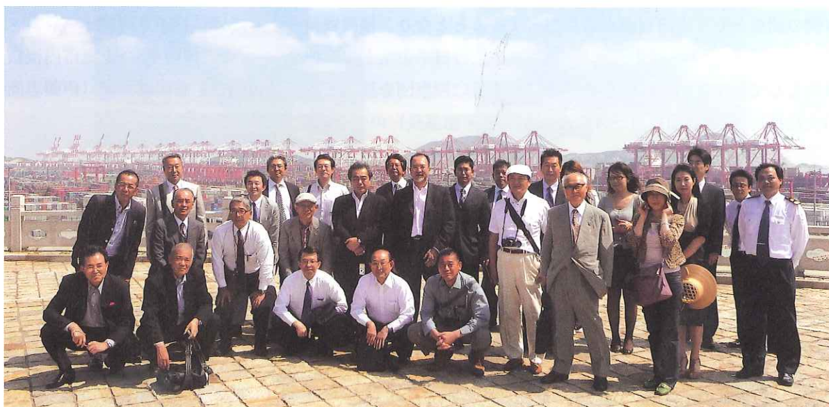
沖合32kmの小洋山島に第4期建設工事が進む洋山深水港