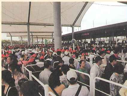
入場を待つ一般入場者