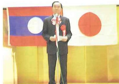
交流会で挨拶するシートン駐日ラオス大使