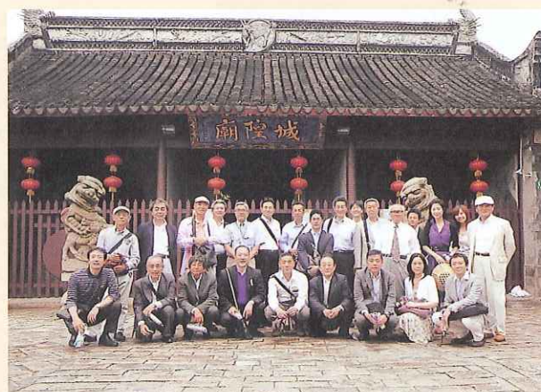
6月4日上海近郊水郷朱家角