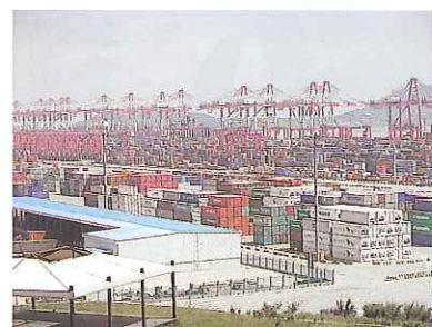
世界第二位の上海港