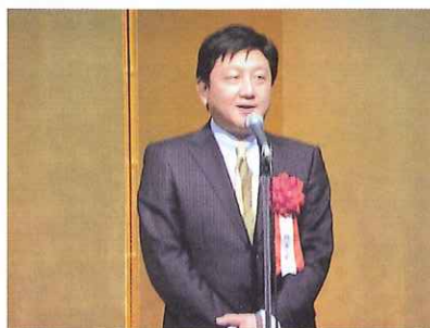
吉田福岡市長の来賓挨拶