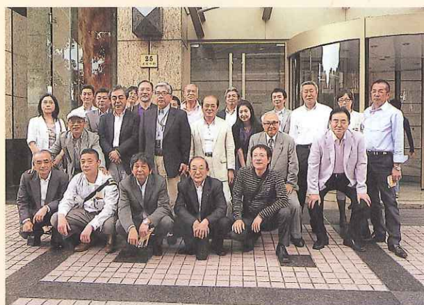
6月4日上海事務所訪問