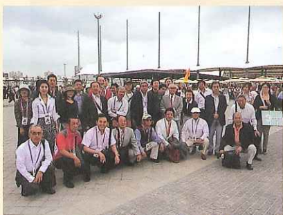
6月3日 万博会場入口