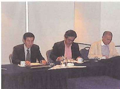
JETRO 中畑氏(写真左)による概況説明