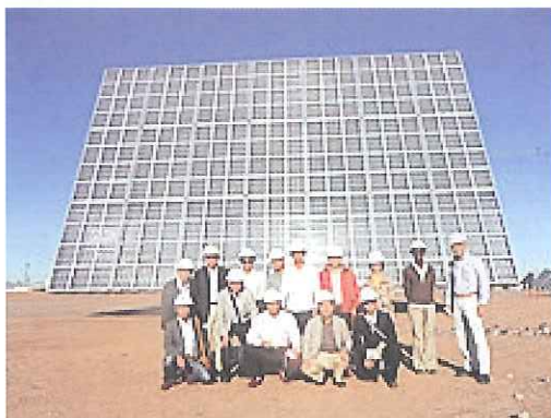
フェニックス APS 太陽光発電パネルの前で