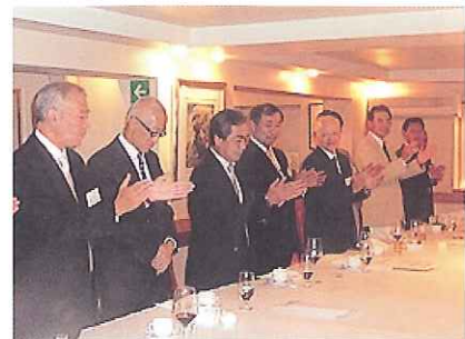
博多手一本で閉会