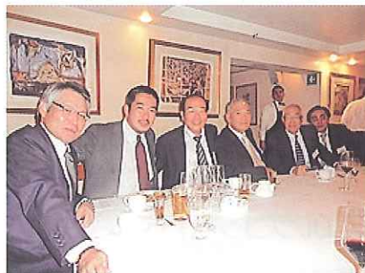
現地日系企業の方を交えての交流会