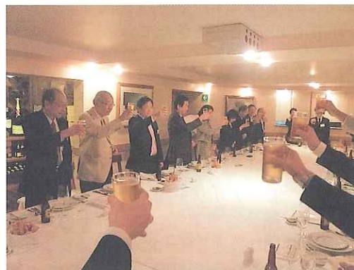
メキシコシティ在大使館・日本人商工会との交流会