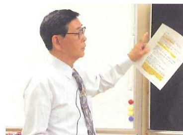
※板書で一杯の黒板を指しながら