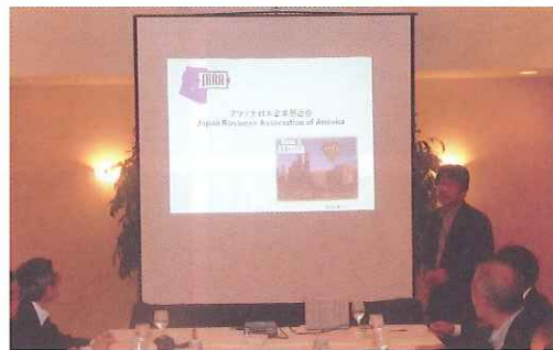
JBAA 福世会長による現地概況説明