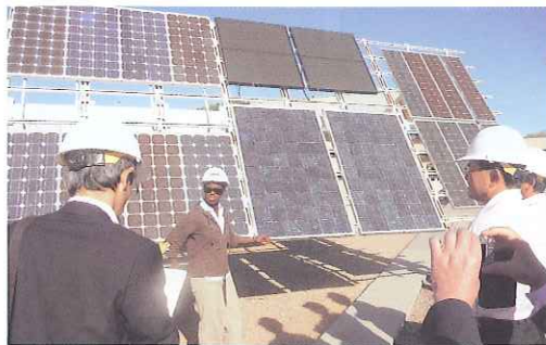
APS 施設の説明を受ける