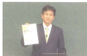
第1部：谷食品衛生専門官