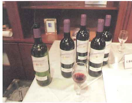
当日試飲した「福岡シティワイン」