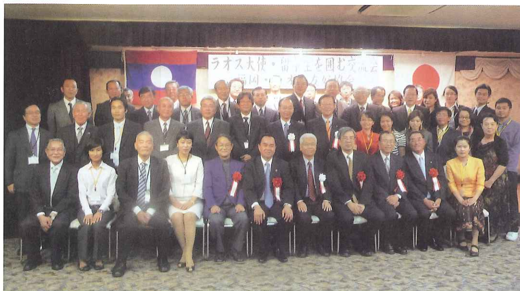
シートン大使 挨拶