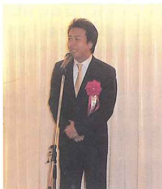
高島・福岡市長挨拶