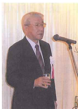
角川副会長、乾杯の音頭