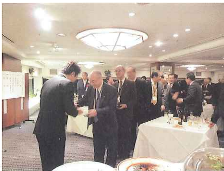
高島福岡市長との名刺交換